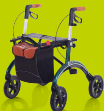
CARBON ROLLATOR Extrem leicht

HOMANN · Borkener Str. 10-12 · Dülmen · T 02594 2235 · www.schenken-kochen-wohnen.de