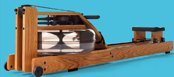
NOHRD WATERROWER Ruder-/Fitnessgerät, verschiedene Holzarten