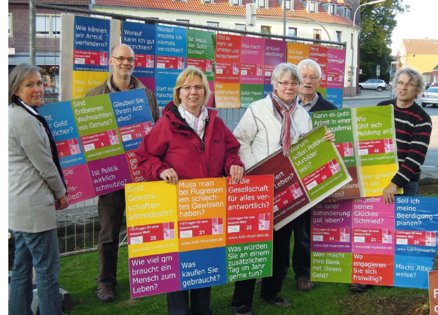
Plakataktion zur Frage der Werte, die für die Gesellschaft wichtig sind

Mit dem bunten Programm versuchen wir, Freizeitgestaltung und politisches Engagement zu verbinden. In jedem Jahr gibt es eine Betriebsbesichtigung, Weiterbildungsangebote, spirituelle Angebote und Freizeitaktivitäten. So bot etwa im Januar beim Kinoabend im Pfarrheim der Film „Nomadland“ die Gelegenheit, sich