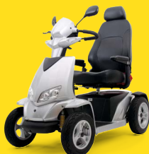
MERITS WESTERLAND Magnetische Bremsen, enorme Reichweite