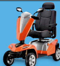
TEXEL Allrounder mit magnetischen Bremsen