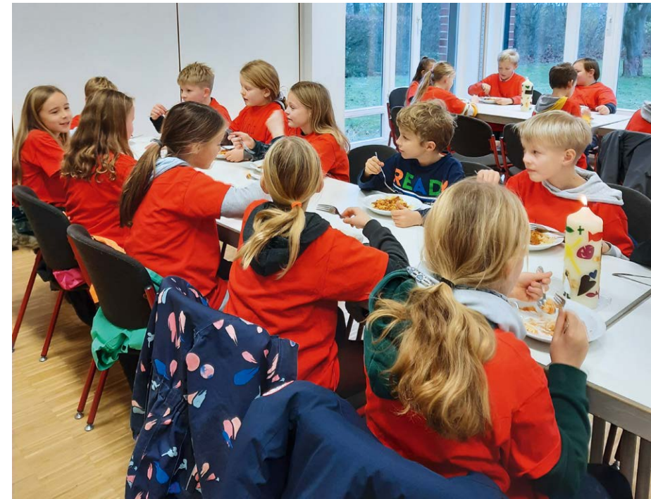
Gemeinsame Mahlzeiten als Abschluss runden in diesem Jahr endlich wieder die Themenblöcke ab.

75 Erstkommunionkinder, 21 Katechetinnen und Katecheten und das Vorbereitungsteam freuen sich, dass die Erstkommunionvorbereitung weitgehend frei von Corona-Einschränkungen stattfinden kann.