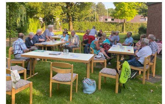
Jahreshauptversammlung unter Coronabedingungen im Grünen

Verkaufserlös wurde in jedem Jahr an ortsansässige Gruppen und Einrichtungen gespendet. So konnten auch die Kreuzkrokodile und Sonnenblumen sowie die Messdienergemein-