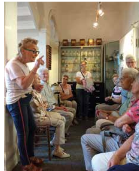
Besuch im Medizin- und Apothekermuseum in Rhede

Zum Ende des Ausflugs verabschiedete uns die jüngst in die Pfarrei in Rhede umgezogene Schwester Kitonyi. Begeistert und dankbar traten alle Senioren die Rückfahrt nach Dülmen an. | Georg Schoofs