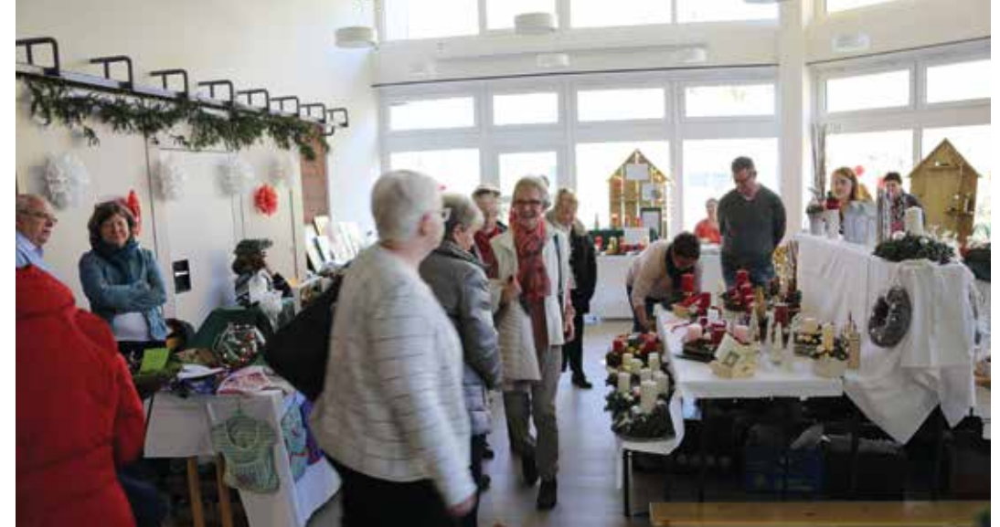
Das Pfarrheim strahlt mit weißem Anstrich und modernisierten weißen Schiebeelementen – alles wirkt viel heller und freundlicher. Hier ein Raumeindruck während des Wintermarktes der kfd Heilig Kreuz.

Alle im Laufe der Zeit nachinstallierten AP-Kabel wurden unter Putz gelegt. Kabel für EDV-Netzwerk und Tontechnik wurden verlegt. Die erforderlichen Geräte hierzu werden später installiert. Die komplette Beleuchtung