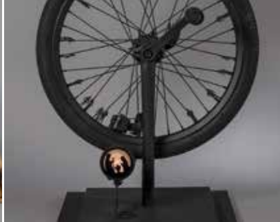
Auf dem Weg, 2018, Installation aus einem Fahrradteil mit Handkurbel, Dynamo und Lampe, Christian Nachtigäller (*1968)