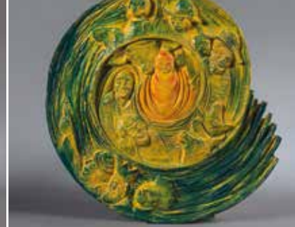
Weihnacht, 1999, Relief, Linde geschnitzt und mit Acrylfarben koloriert, Martin Schonhardt (*1963)

zen hingeben. Viele der diesjährigen Aussteller haben sich Gedanken darüber gemacht, wer heute „zur Krippe her kommen“ könnte. Da sind die bekannten Figuren, die Hirten und Könige. Doch der Personenkreis wird in der Ausstellung erweitert, denn die Botschaft lautet: Alle Menschen sind eingeladen, dem Kind zu begegnen, jeder auf seine Weise. So kommen junge und alte Menschen zur Krippe, Menschen mit Behinderungen, Politiker und auch der Kiepenkerl. Das Spektrum reicht von der traditionellen Figurenrippe über Gemälde bis zur modernen Installation.