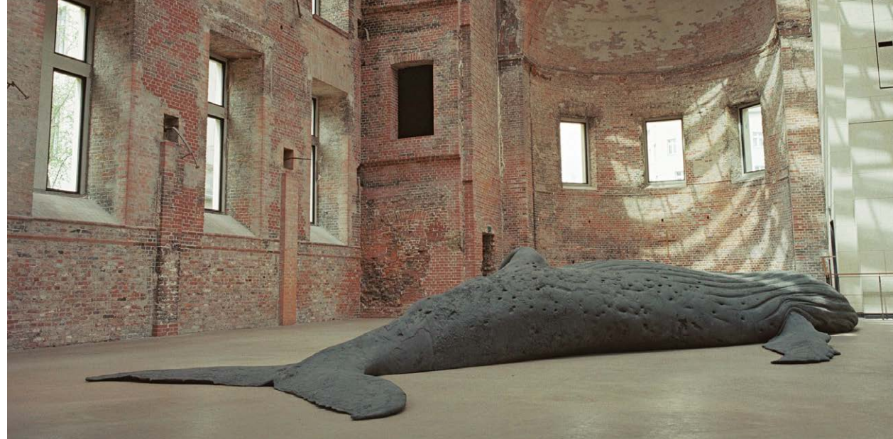
Die Wal-Skulptur des Künstlers Gil Shachar in der Elisabethkirche in Berlin

Da muss ich etwas ausholen. Im Museum in Bochum wurde sehr eindrucksvoll der Abguss eines toten Wals vorgestellt, der auf dem Rücken lag. In einem benachbarten Saal wurde ein Film vorgeführt, der den gesamten Abformprozess in Südafrika dokumentiert. Begleitend wurden die Klänge der „Litany for the Whale“ von John Cage abgespielt, die auch in dem Saal mit dem Wal-Abguss leise hörbar war. In dieser Atmosphäre wurden die Besucher nahezu angehalten, über den schlechten Zustand der Meere und der Erde nachzudenken. In dem Saal mit der Filmvorführung wurden auch ganz unterschiedliche Papierarbeiten mit