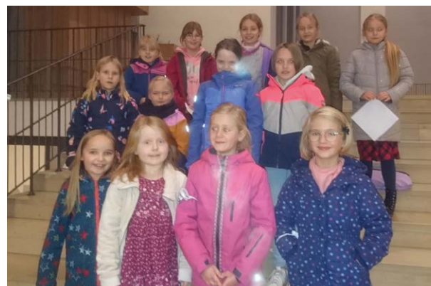
Endlich haben wir wieder einen "Auftritt" – Der Kinderchor singt beim Martinsfest des Kreuzkindergartens.