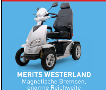
MERITS WESTERLAND Magnetische Bremsen, enorme Reichweite