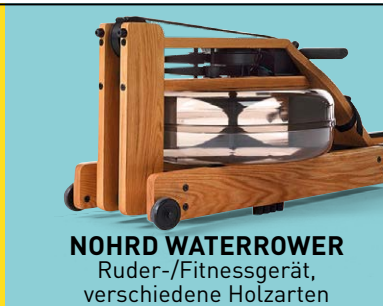
NOHRD WATERROWER Ruder-/Fitnessgerät, verschiedene Holzarten

49,- € RABATT BEI SELBST- ABHOLUNG RUDERGERÄT