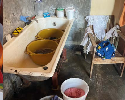
Hier wird die Wäsche mit der Hand gewaschen.