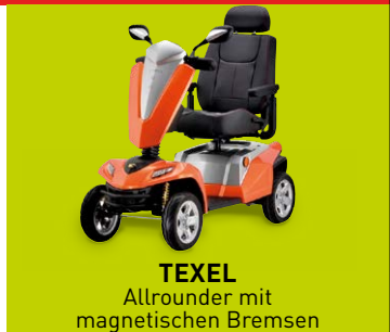
TEXEL Allrounder mit magnetischen Bremsen

HOMANN · Borkener Str. 10-12 · Dülmen · T 02594 2235 · www.lebensfreude-by-homann.de