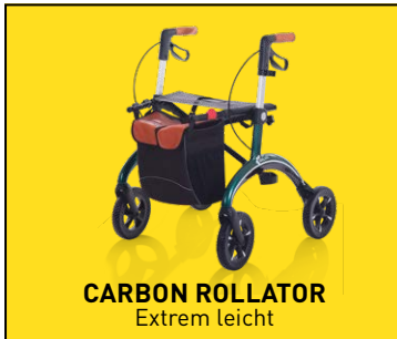
CARBON ROLLATOR Extrem leicht

HOMANN · Borkener Str. 10-12 · Dülmen · T 02594 2235 · www.schenken-kochen-wohnen.de