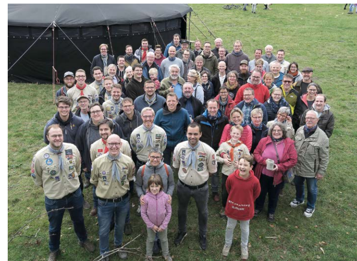
Etwa 90 Mitglieder folgten zur Freude der Organisatoren der Einladung zum Pfadfinderplatz im Dernekamp.