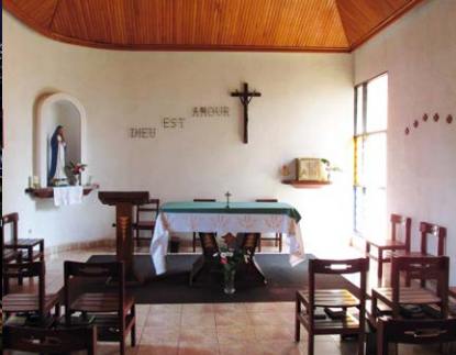
Die Kapelle in Gikondo