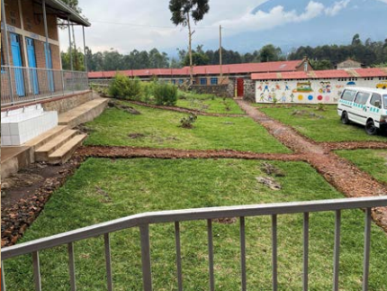
... der Schulhof der Schule.