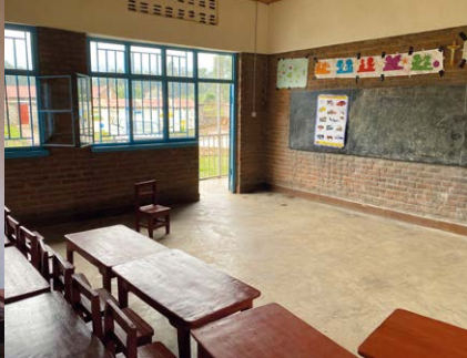
Felicitas Arbeitsplatz ist die „Ecole Maternelle Saint Vincent Pallotti Kinoni“: Ein Klassenraum und ...