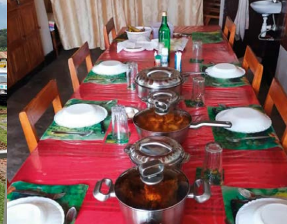
Der Essenstisch in Kinoni