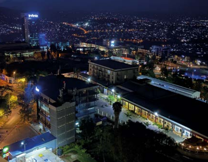
Ausblick auf Kigali bei Nacht